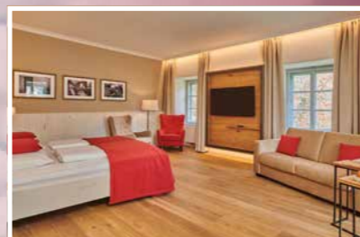
Hammerherrensuite ca. 45 m 2

Genießen Sie den Ausblick zur Altstadt und zur kristallklaren Ybbs. Unsere Hammerherrensuite besticht durch einen sehr gemütlichen Wohnbereich und die großzügige Ausstattung.