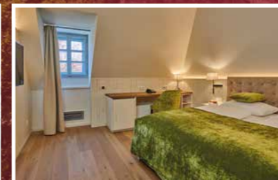
Schlosszimmer ca. 28 m 2

Die romantisch eleganten Schlosszimmer im historischen Schloss sind ideal für einen Kurzurlaub. Unsere Schlosszimmer im ersten Stock bieten zudem noch Zugang auf unsere Schlossterrasse!