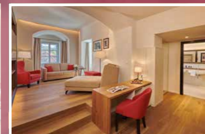
Turmsuite ca. 50 m 2

Ein sehr gemütlich angelegter Aufenthaltsbereich und ein großzügiges Badezimmer verleihen dieser 50 m 2 großen Suite seine einzigartige Atmosphäre.