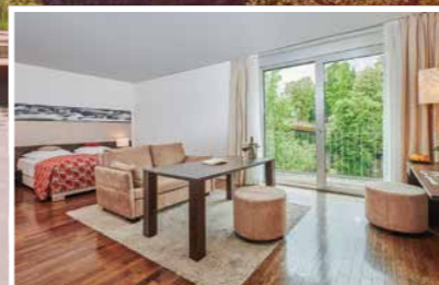
Family Ybbszimmer ca. 40 m 2

Die Family Ybbszimmer bieten mit über 40 m 2 genügend Platz für Ihren Familienurlaub. Genießen Sie die Moderne, verbunden mit historischem Stil samt Blick zur Altstadt Waidhofens und zum historischen Rothschildschloss.