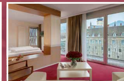
Rothschildsuite ca. 50 m 2

Vom Bett aus genießen Sie einen unvergleichbaren Ausblick auf das gegenüberliegende Rothschildschloss. Großzügiger Aufenthaltsbereich, extra Kinderzimmer, modernes Ambiente und Balkon.