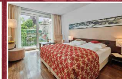
Ybbszimmer ca. 26 m 2

Ein wunderschöner Ausblick auf die kristallklare Ybbs und das mittelalterliche Rothschildschloss sowie geradliniges Interieur. Genießen Sie die Moderne, verbunden mit historischem Stil.